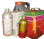
PPNU (Produits Phytopharmaceutiques Non Utilisables)