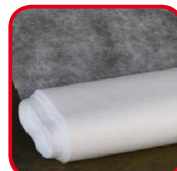
Voile non tissé, dont le P17