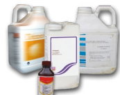
Bidons en plastique de produits phytopharmaceutiques et oligo-éléments