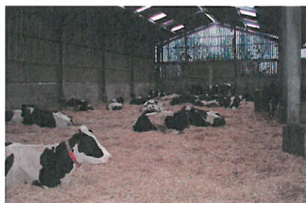
Photo 2 : Le fumier très compact de litière accumulée peut être stocké aux champs après avoir séjourné deux mois dans les installations.