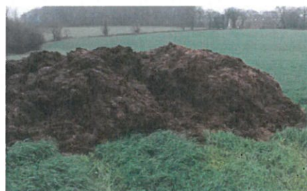
Photo 1 : Fumier compact non susceptible d'écoulement stocké aux champs avant épandage.

Ils devront être stockés dans des fumières aménagées (avec récupération des purins) jusqu'à leur épandage. Pour les bovins, de 4 mois à 5,5 mois de stockage minimum sont nécessaires (cf. tableau 1).