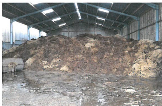
Photo 7 : Fumier compact issu de logettes bien paillées en cours d'égouttage.

théorique calculée pour 2 mois. Cela donne de la souplesse pour gérer le fumier en stock, assurer un bon égouttage et ne pas être contraint de faire le dépôt aux champs dans des conditions parfois difficiles à cause d'un épisode pluvieux qui se prolonge.