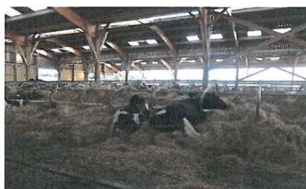
Photo 3 : Sous conditions spécifiques, certains fumiers de raclage peuvent être stockés aux champs.