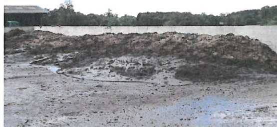
Photo 4 : Les fumiers mous à très mous ne peuvent en aucun cas être stockés aux champs.

Conseil : Les fumiers mous sont à éviter car ils sont difficiles à stocker, à manipuler (mauvaise tenue du tas) et sont compliqués à épandre. Ils nécessitent en outre des surfaces de fumière très importantes (vu la faible hauteur d'entassement) qui génèrent de grands volumes de purin en période pluvieuse. Si l'opportunité se présente, leur valorisation en frais dans une unité de méthanisation, peut constituer une alternative au tout stockage en fumière.