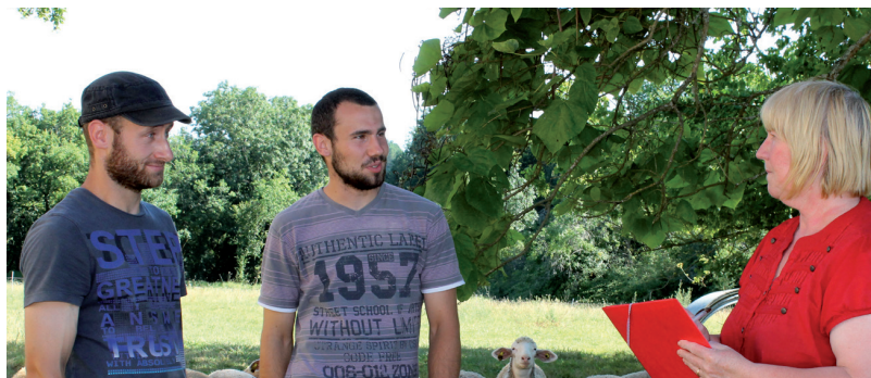
Suivi post installation