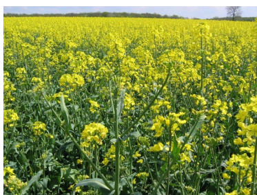
Planter des oléoprotéagineux

La conduite des prairies actuellement en place constitue la meilleure solution pour diminuer la dépendance aux achats extérieurs de tourteaux. Par ailleurs, il existe d'autres possibilités pour gagner en autonomie protéique, à adapter en fonction du contexte spécifique de chaque exploitation.