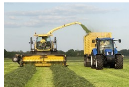
Récolter précocément les prairies