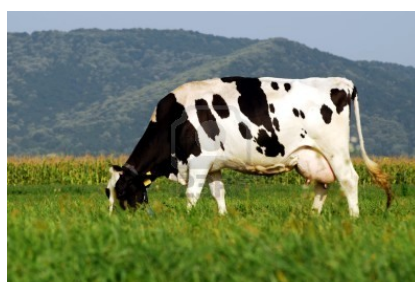
Adapter la conduite du pâturage

La matière azotée peut être produite par une diversité de cultures sachant que la prairie reste la ressource la plus importante de production de protéines à l'hectare sur nos exploitations landaises. Concernant la valeur unitaire des concentrés et des fourrages, le tourteau de soja représente la référence par sa forte teneur en protéines.