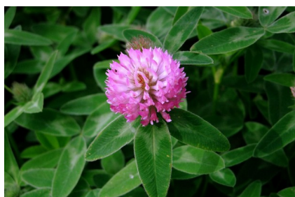
Installer des légumineuses