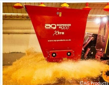
AG Products AGFS200