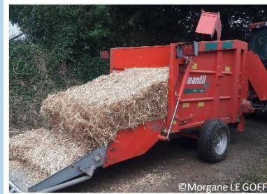
Jeantil P 4200 RE