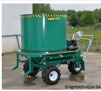
WIC (ou Approdis)