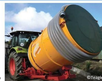
Electra BHD SP' S'