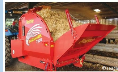
Teagle Dual Chop