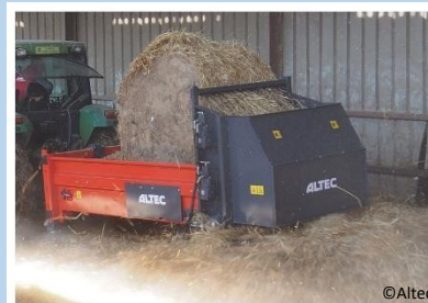
Altec DT250 portée