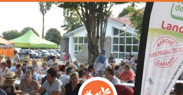
MPP à Grenade sur l'Adour