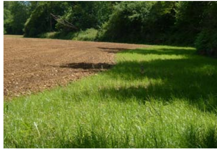
En 2010, tous les cours d'eau identifiés par l'arrêté préfectoral devront être bordés de bandes « tampons ».

La dotation complémentaire est calculée en fonction des surfaces en herbe, en maïs dans les exploitations avec élevages, et en légumes de plein champ, déclarées au cours de l'année de référence. C'est la partie de vos aides couplées redistribuée entre exploitations.